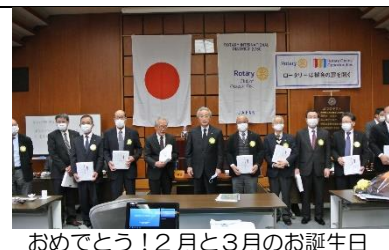
おめでとう！2月と3月のお誕生日の皆さん