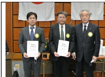
次年度地区出向委嘱状授与