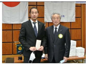
米山奨学生へ奨学金の授与