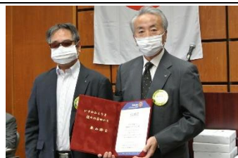
米山記念奨学会より感謝状