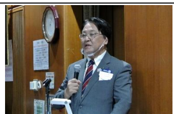
講演する内田市長