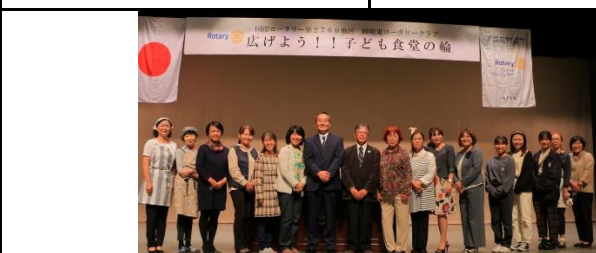
おかざき子ども食堂・みんなの食堂連絡協議会“わーく”の皆様