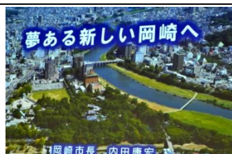
岡崎市長 内田康宏 本日の卓話