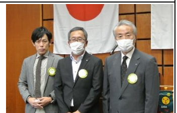
皆出席おめでとう！