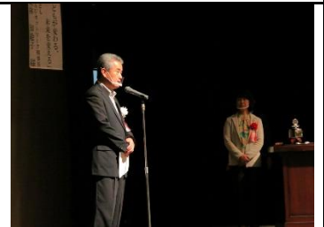
畔柳副会長よりお礼の言葉