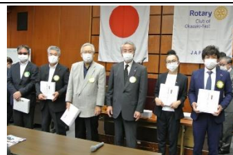
10月誕生日おめでとう！