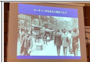
ロータリーが生まれた頃のシカゴ