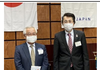
会長よりお礼の言葉