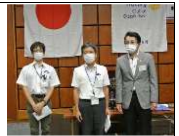
会長よりお礼の挨拶