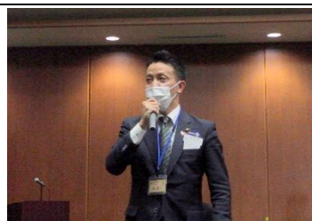
卓話テーマ：「はたらく」