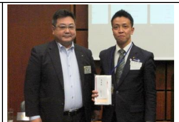
南副会長よりお礼の言葉