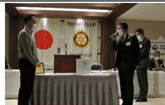
酒井会長よりお礼の言葉