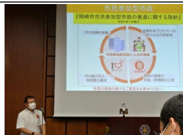
市民参加型市政を説明する市長