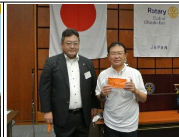
南副会長より卓話お礼の言葉