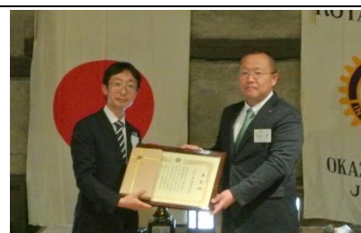
稲垣会長より表彰状・記念品授与