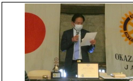
倉内職業奉仕委員長より卓話者紹介