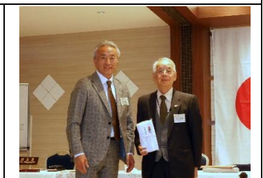
副会長よりお礼の言葉