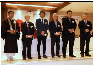
4月お誕生日の皆さん

ロータリアンの義務は①例会に出席②時間厳守③ロータリーの友の購読④新会員の推薦⑤委員になり積極的に活動⑥地域各種業界の代表としての責任があります。ロータリークラブで安定的に活動できる会員数は80人であると思います。岡崎東ロータリークラブでピーク時には100人を超えておりましたが、現状は60人をきっております。皆さんにお願いしたいのが会員の増強です。入会して10~15年の会員は一年に推薦が2人、入会が1人を目標にして努力してほしい。スポンサーになってくれている方のトップは7人ですが、0人の方がかなり多くいらっしゃいます。0人の方は少なくとも年度内に1人以上は推薦をあげていただきたいです。これはクラブ運営の中で大変重要だと思っております。皆さんの負担が大きくなる前に、努力していただきたいと思っております。