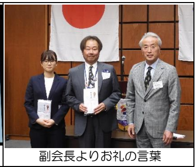
副会長よりお礼の言葉