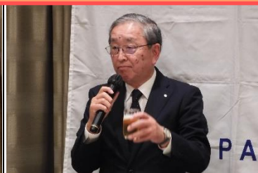
乾杯のご発声：清水会長エレクト