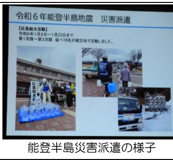
能登半島災害派遣の様子