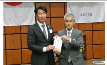
畔柳会長よりお礼の言葉