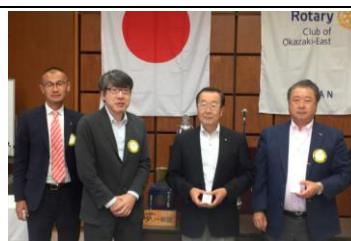
皆出席おめでとう！