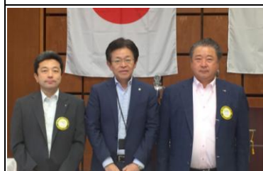
7 月のお誕生日おめでとう！