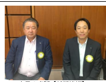
本日の卓話【就任挨拶】