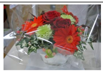
姉妹クラブ松本東 RC より祝電