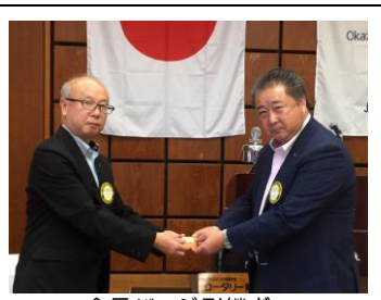
会長バッジ引継ぎ