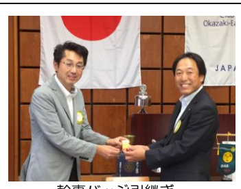
幹事バッジ引継ぎ