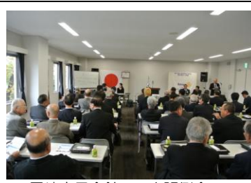
岡崎市民会館での出張例会