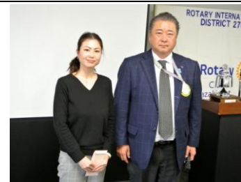
会長よりお礼の言葉