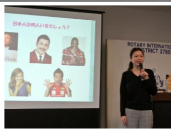
「多文化共生社会への取り組み」