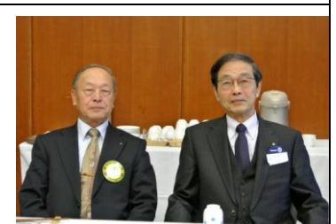
ようこそ！本日のビジター様