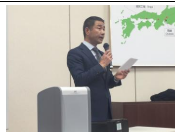
卓話者紹介:石川職業奉仕委員長