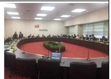
三菱自動車工業(株)岡崎製作所