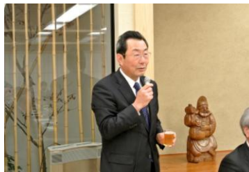
野村会長エレクト 乾杯のご発声