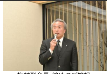
梅村副会長 締めのご挨拶