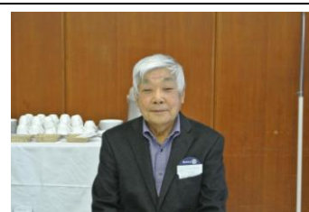
ようこそ！本日のビジター