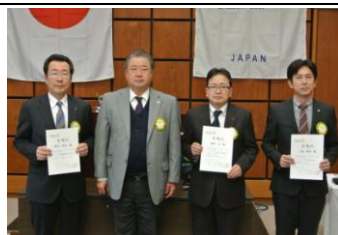
次年度地区委員へ委嘱状授与