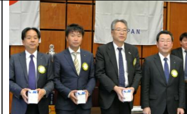
おめでとう! 11月お誕生日の皆様