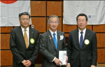
宇野副会長よりお礼の言葉