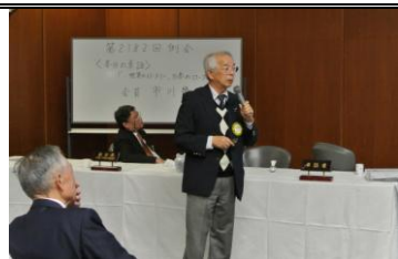
「世界のロータリー、日本のロータリー」