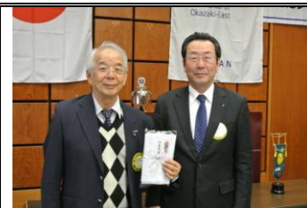
野村会長よりお礼の言葉