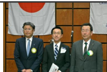
宇野副会長よりお礼の言葉