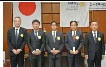
11月お誕生日おめでとう！