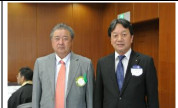
ようこそ！本日のビジター