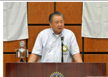
生駒会長「一年を顧みて」