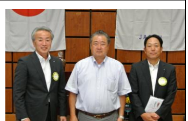
梅村副会長よりお礼のご挨拶