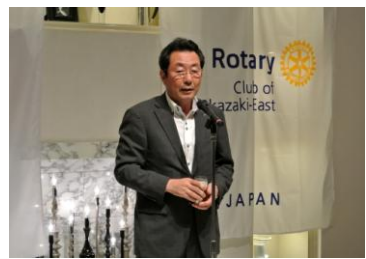
乾杯のご発声：野村エレクト