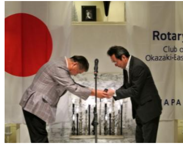
点鐘木槌の引継ぎ