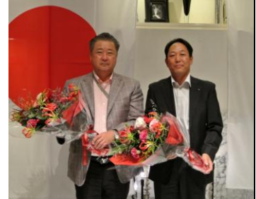
一年間お疲れ様でした！