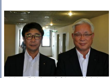
ようこそ！本日ビジターの皆さん