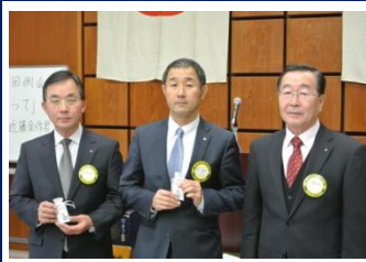
会員増強バッジ贈呈