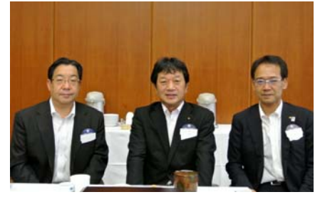
ようこそ！本日ビジターの皆様