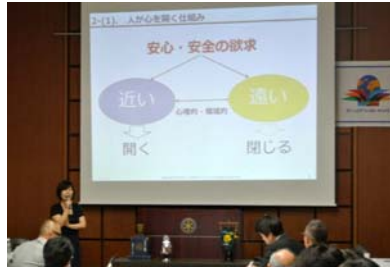
卓話：コミュニケーションのタイプ分け