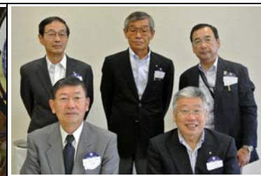
ようこそ！本日のビジター様