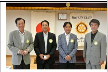
皆出席おめでとうございます