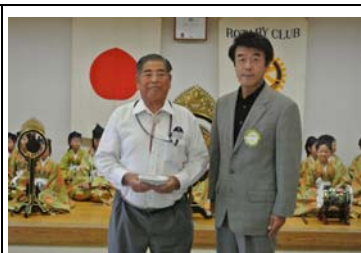
長瀬楽人会へ助成金贈呈