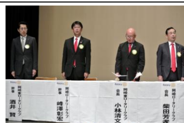
岡崎 RC・岡崎東 RC 合同例会