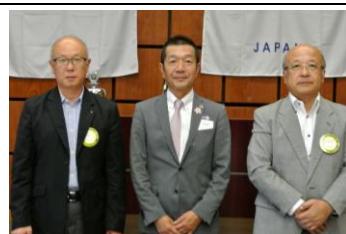
中川副会長よりお礼挨拶