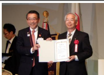
前年度ホストクラブへ感謝状