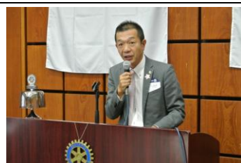
安心して暮らせる安全な地域の為に