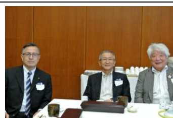
ようこそ！本日のビジター様