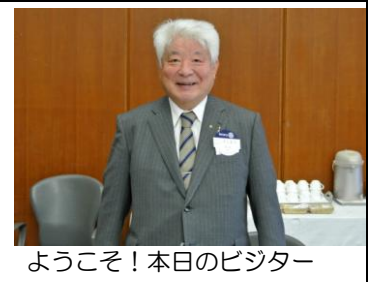
ようこそ！本日のビジター