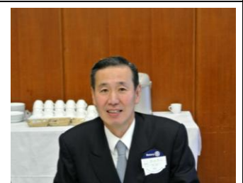
ようこそ！本日のビジター